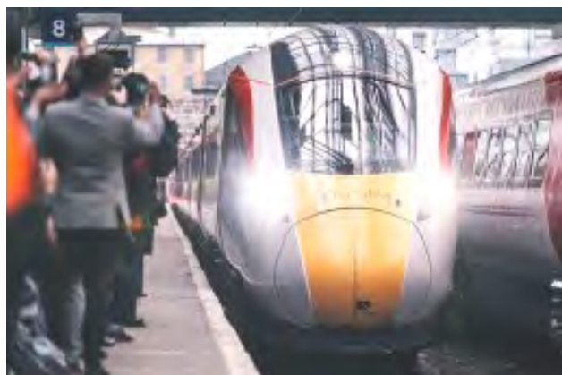
Прошле недеље, „Virgin Trains“ представио први воз из свог новог возног парка

Компанија „Virgin Trains“ приказала је прошлог месеца први воз из свог новог возног парка, на церемонији на King’s Cross станици, којој је присуствовао и Sir Richard Branson , оснивач „Virgin Grpoue“. Одлучна да направи револуцију у путовањима на Источној обали од 2018. године, компанија ће додатно унапредити приступ корисницима, увођењем воза „Virgin Azuma“ који ће бити један од најнапреднијих на железничкој мрежи УК.