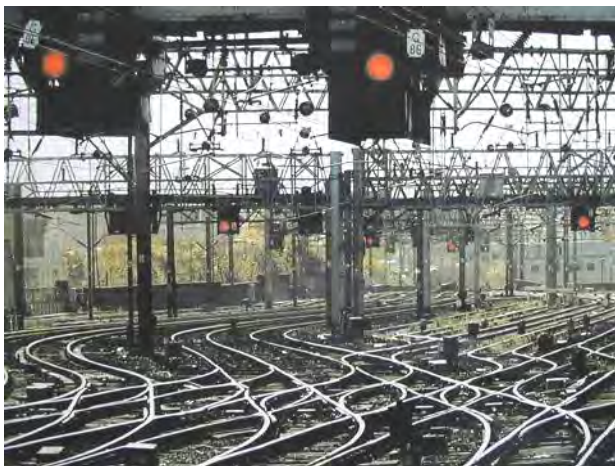
У 2015. години, није било случајева са смртним исходом у железничким удесима у Великој

Према подацима за 2015. годину, које је 9. марта објавила непрофитна организација „Железничка група стандарда и сродних докумената“ ( RSSB ), већ осму годину заредом, у Великој Британији није било људских жртава међу путницима и запосленима. Укупан број смртних случајева је смањен, док се бележи константни пораст броја путника, са регистрованих 1,68 милијарди путовања током прошле године.